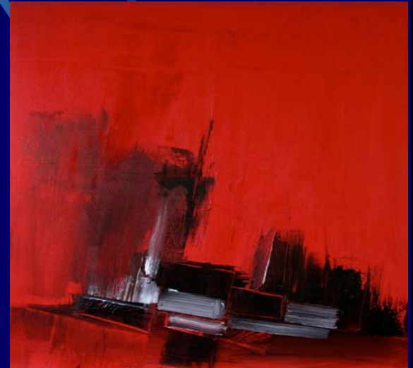
Erick Deroost « Construction »

Espace CCI - 21 Quai des Indes Entrée libre