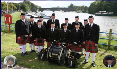
Mc Neillstown Pipe Band

14h30 Musiques et Danses des Pays Celtes Grupo de danza Cantigas e Agarimos (Galice) Perraa T (Cornouailles) Mc Neillstown Pipe Band (Irlande) Espace Marine - 7€