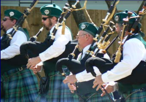
Queensland Irish Association Pipe Band

Vendredi 8 Août journée / Gwener 8 a viz eost an devezh