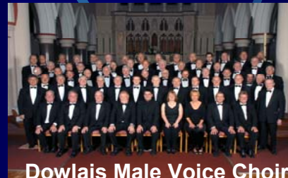
Dowlais Male Voice Choir

21h30 Musiques sacrées Pays de Galles Eglise Saint Louis - 13€ - tarif réduit : 11€