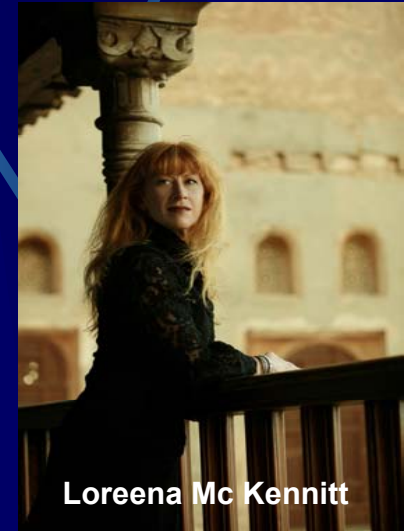
Loreena Mc Kennitt

22h30 Nuit Magique Bretagne avec la participation exceptionnelle des bagadoù champions de Bretagne 2008 des 1 ère et 2 ème catégories Stade du Moustoir - Présidentielle Carré Or 21€ - Tribune Présidentielle 17€ (Tarif réduit 14€) – Tribune Nord 15€ (Tarif réduit 12€)