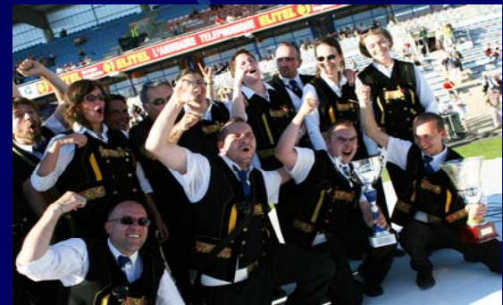
Bagad Brieg Champion 2007