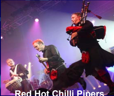
Red Hot Chilli Pipers

19h00 Nuit du Port de pêche avec Dominique Dupuis , Red Hot Chilli Pipers , IMG Début du spectacle à 21h - Feux d'artifice à la fin du spectacle Port de pêche - 8€