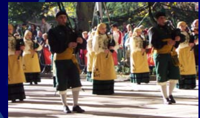
La Reina del Truebano