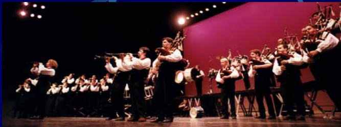
Bagad St Nazaire